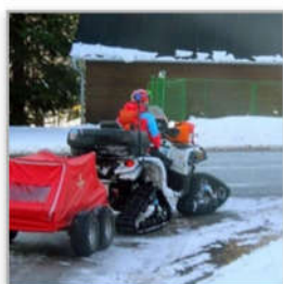
Foto ilustrační z jiného zásahu Horské služby