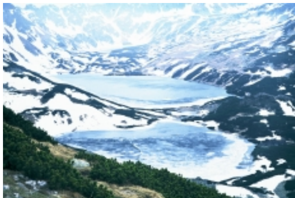
dolina Piatich poľských plies