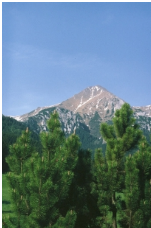
pohľad z ústia Monkovej doliny na Ždiarsku vidlu (fotoreportáž na str.10.)