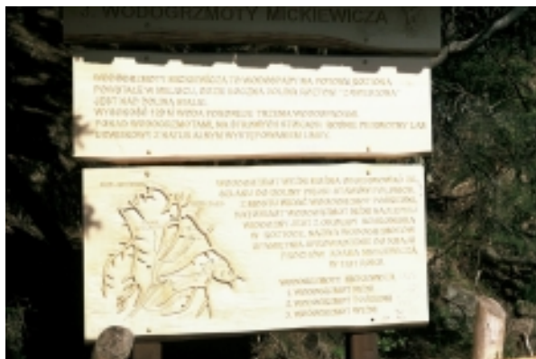
tabuľa NCH pri vodopáde Mickiewicza

pleso "Morské oko", v pozadí sedlo Váha a Rysy - hraničný hrebeň so SR