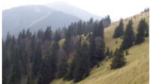
(za dodanie fotografií Rozsu Sándora, ktorými je ilustrovaná časť príspevkov tohto čísla v digitálnej podobe, ďakujeme Jurajovi Popovicovi)